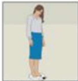
Scăderea în greutate