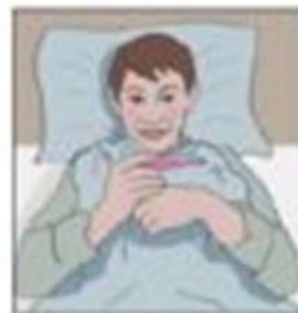
Febra care nu cedează