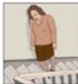
Senzația de slăbiciune, oboseală și respirația tăiată

Aceste simptome sunt semne obișnuite și pentru alte boli. Așadar, pentru a fi siguri că este vorba de TBC, trebuie să faci diferite analize. Cineva care prezintă unul sau mai multe dintre aceste simptome ar trebui să