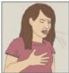
O tuse persistentă care durează mai mult de 2-3 săptămâni