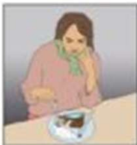
Pierderea poftei de mâncare