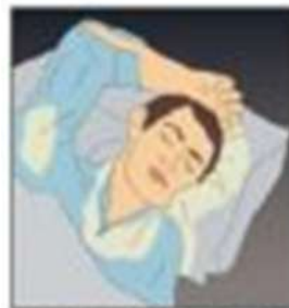
Transpirație în timpul nopții